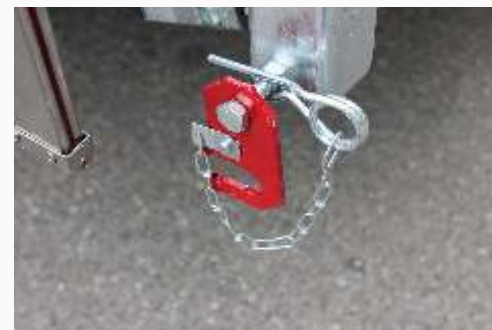
Verriegelung für abgeklappte Bordwand