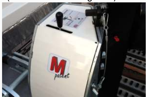
E-Hydraulik inkl. Funk