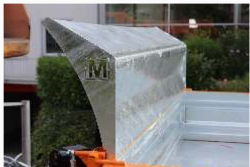
Schippe (Bordwanderhöhung vorn)