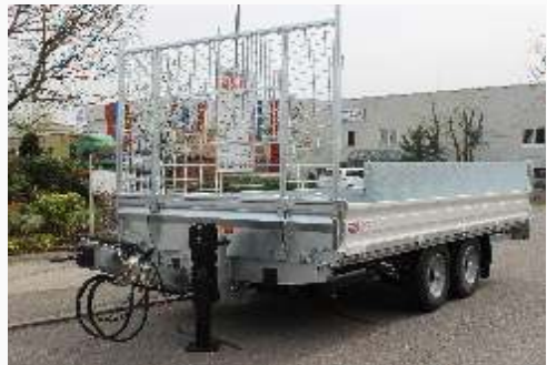
H-Gestell mit Gitter